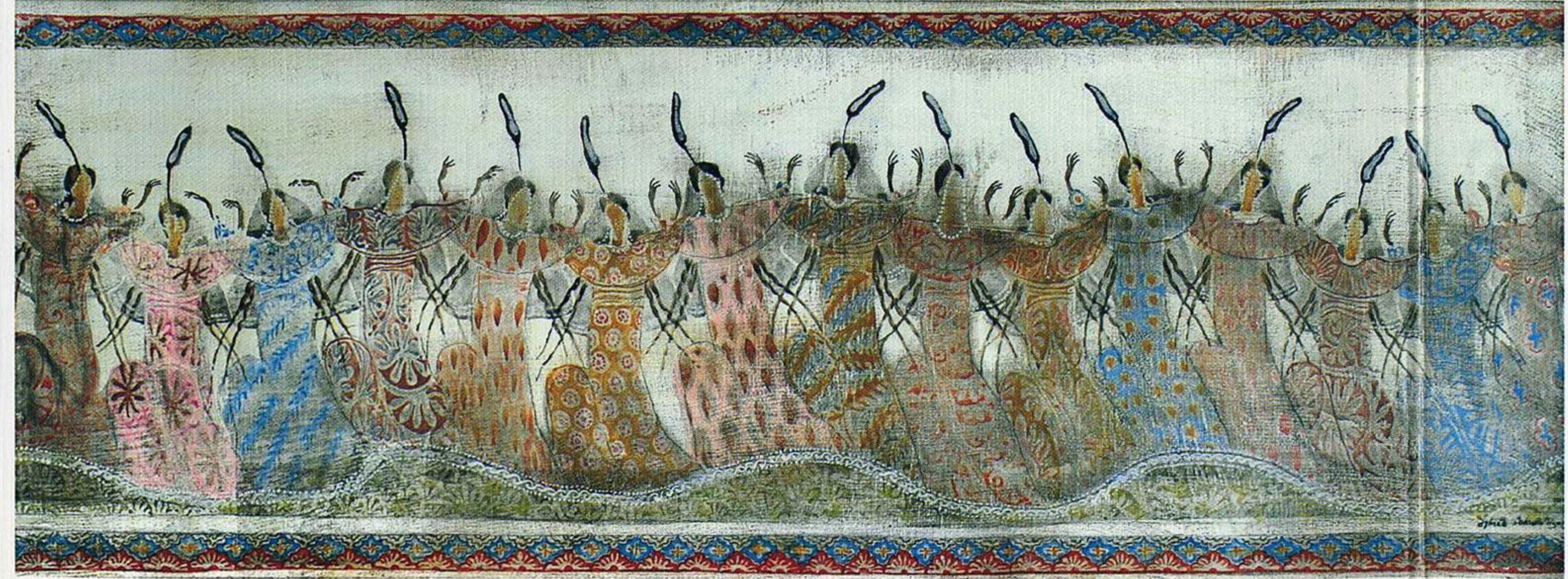
აბრეშუმის გზა Silk Road