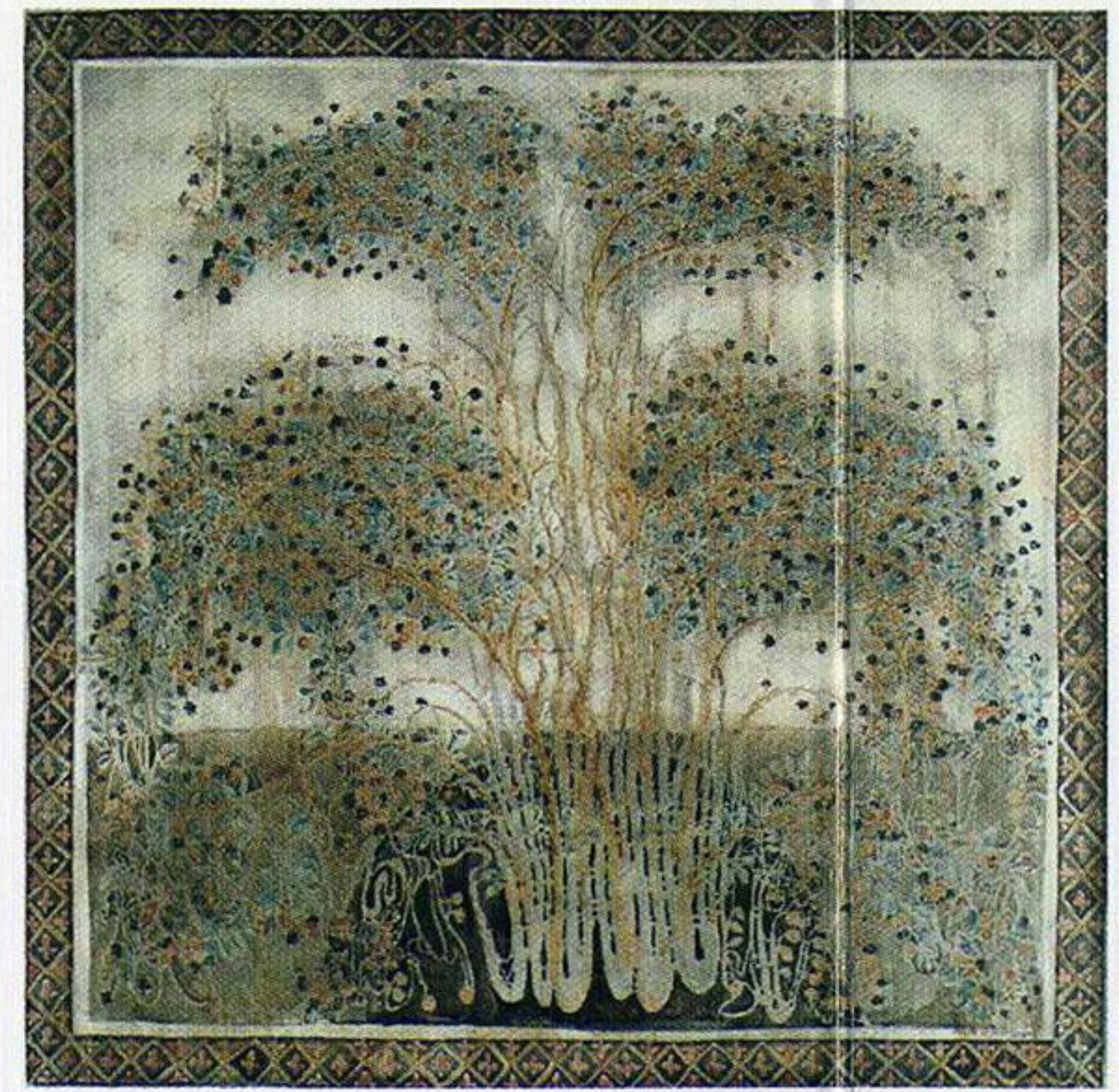
მაყვლის ბუჩქი Blackberry Bush