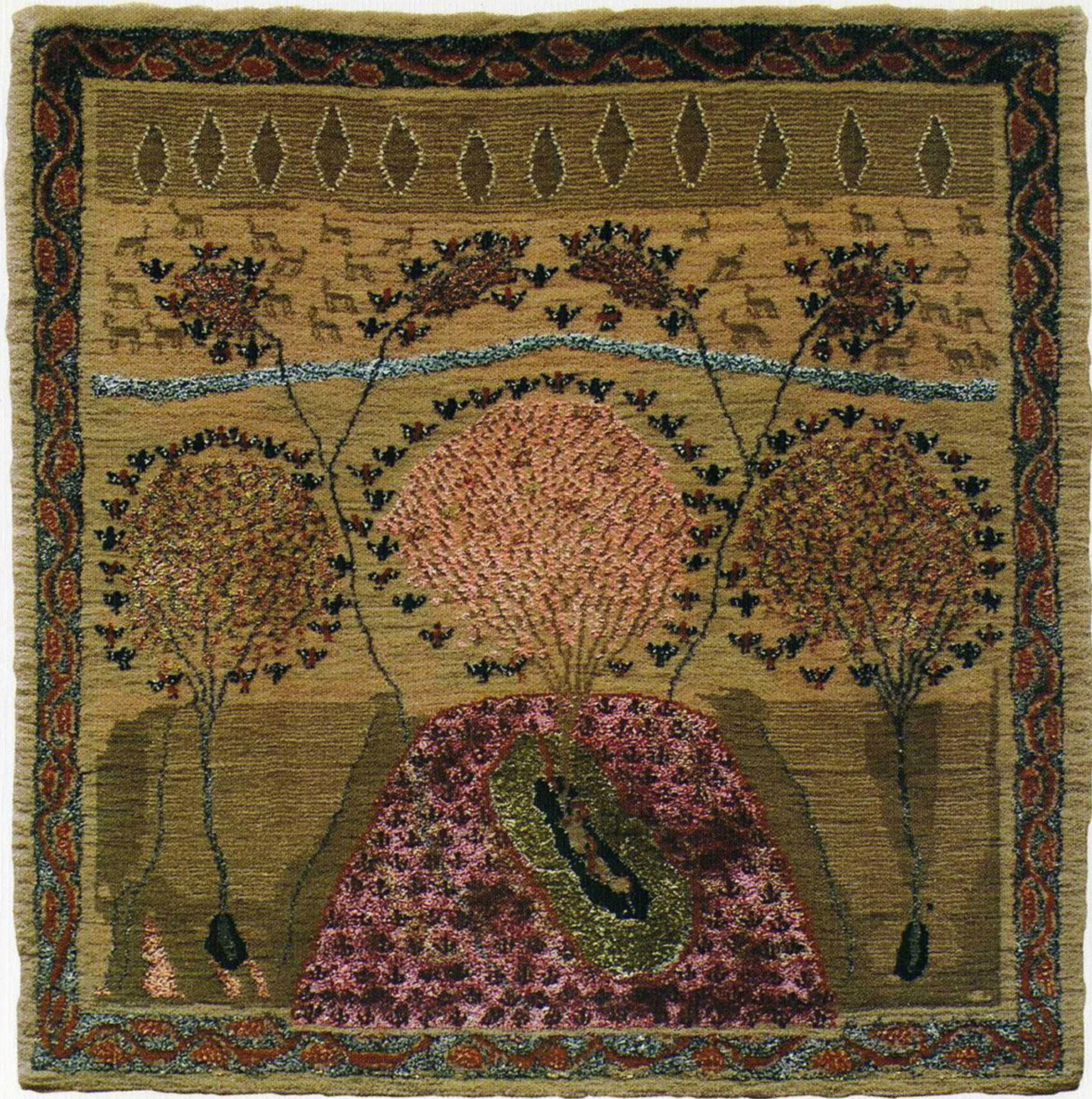
სამოთხე 50x50 ხატიჩა, აბრეშუმი: 2006 მოქსოვილია ფერისცვალების დედათა მონასტერში Woven in Convent of Transfiguration