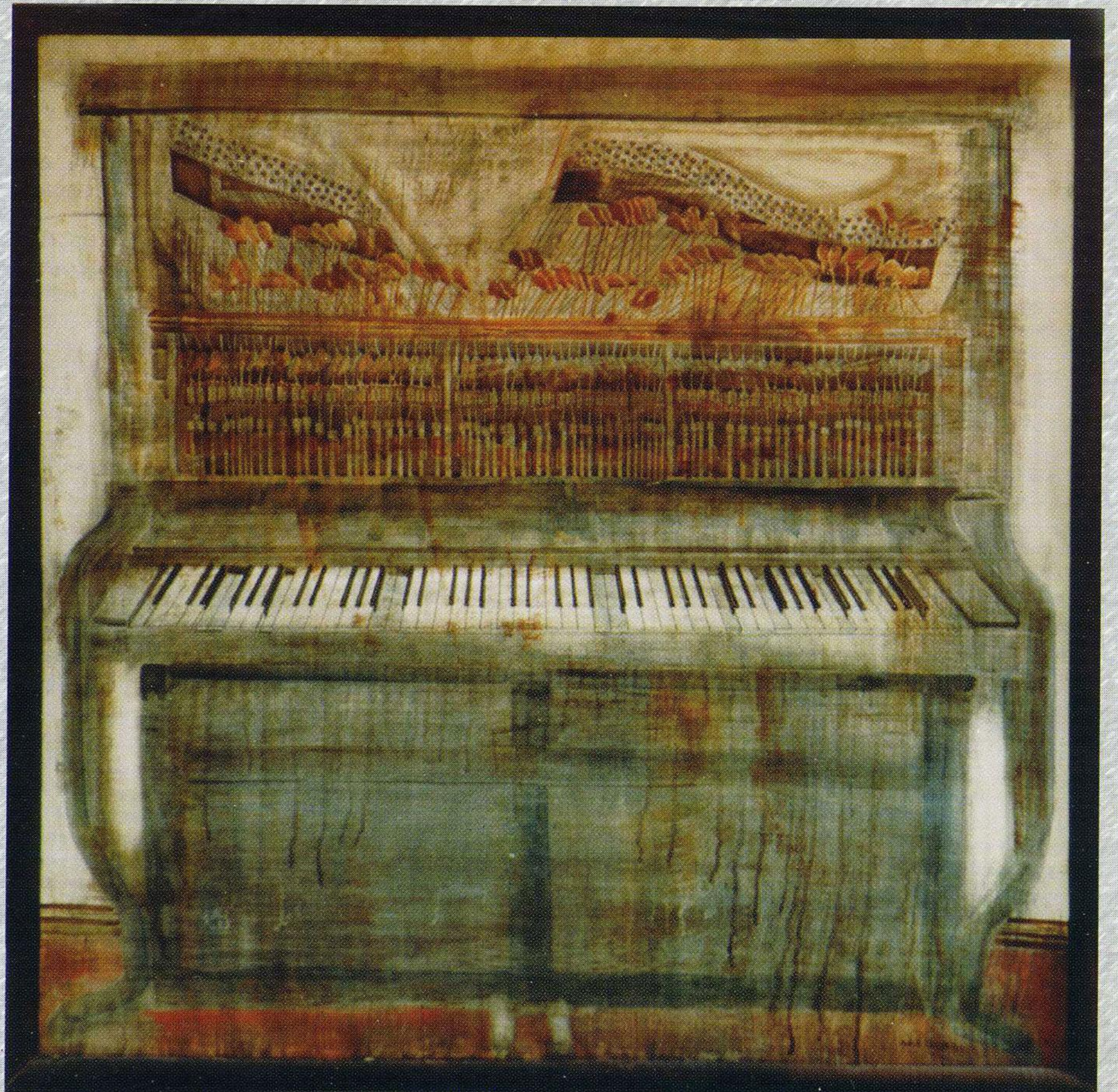
Piano 70x70cm oil on board